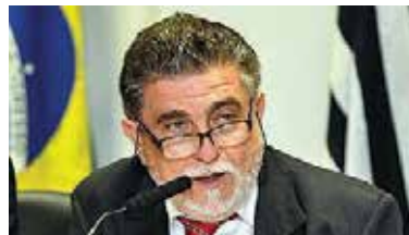
Ortiz está satisfeito com os resultados