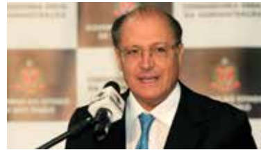
Alckmin liberou aumento no valor do empréstimo

Os itens básicos são faixas refletivas nos equipamentos e nos coletes, proteção para as pernas (conhecidas como “mata-cachorro”), e antenas para evitar acidente com linhas de pipas, além de taxas relacionadas à documentação. O prazo médio para a liberação dos recursos é de dois dias úteis, após a entrega da documentação exigida para formalização da operação.